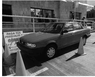
Este mes se rifará de nuevo el 'rojo' entre los contribuyentes cumplidos.

"Recibimos el planteamiento de otro tipo de procedimientos para que 'salga' rápido", destacó el Alcalde, "por lo que lo vamos hacer entre la gente que ha cumplido sus com-